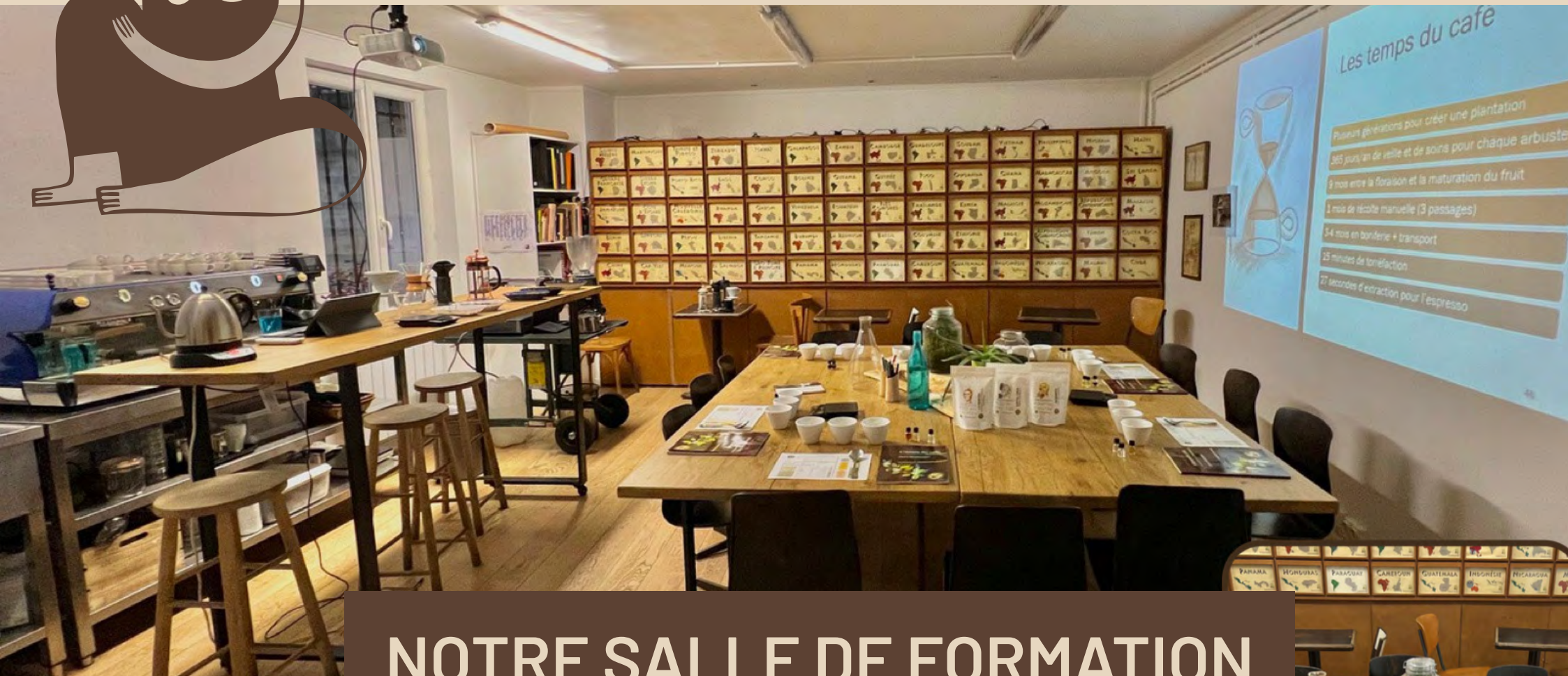
NOTRE SALLE DE FORMATION

Les temps du café Plusieurs générations pour créer une plantation 365 jours/an de veille et de soins pour chaque arbuste 3 mois entre la floraison et la maturation du fruit 3 mois de récolte manuelle (3 passages) 3-4 mois en boîtier + transport 25 minutes de torréfaction 27 secondes d'extraction pour l'espresso